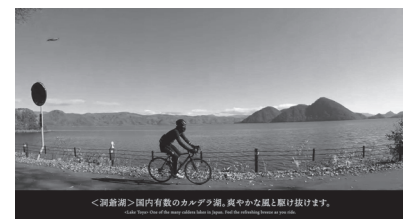
サイクリングルート紹介動画

P R 冊子コース掲載ページQRコード読取 サイクル・ツーリズム北海道推進連絡会 Webサイトに掲載