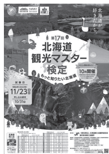
北海道観光マスター検定