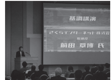
データセンターセミナー