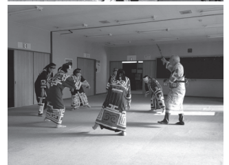
稼ぐ観光検討会(モニターツアー)