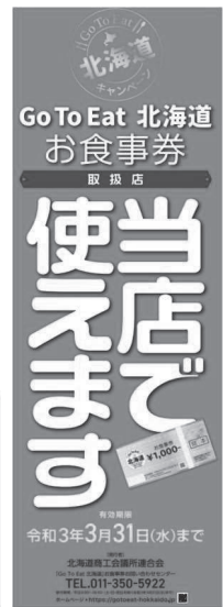
登録店掲示 ポスター