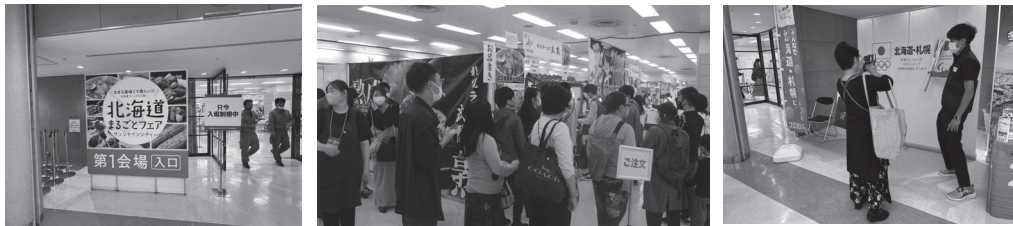
北海道まるごとフェアinサンシャインシティ(会場入口、物産展、PRステージ)

実施日 令和4年10月7日(金)～11日(火) 場 所 サンシャインシティ(東京・池袋) 来場者数 32,352名 物産展出店数 道内25市町村61企業/団体(62ブース)