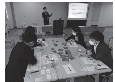
SDGs情報提供(小樽開催)