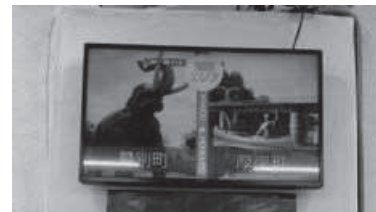
地域の魅力発信による 観光誘客促進イベント