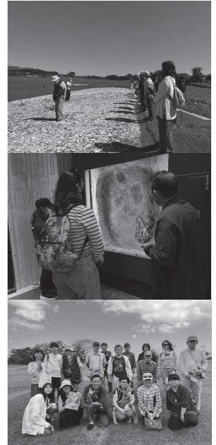
縄文遺跡群ツアー