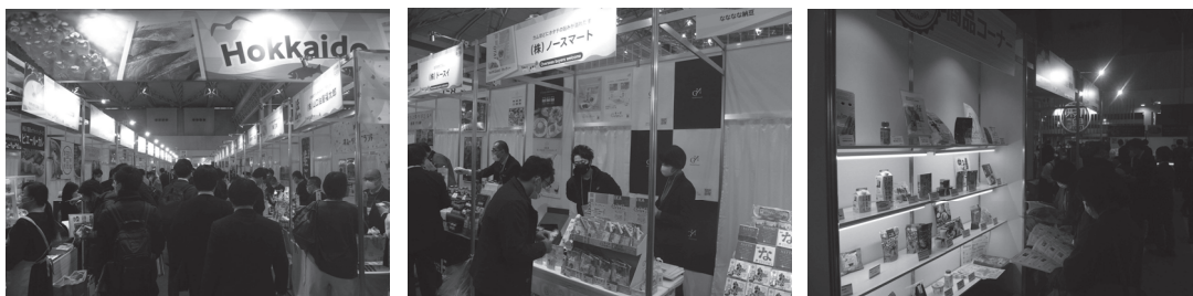
第57回スーパーマーケット・トレードショー2023「北海道コーナー」

実施日 令和5年2月15日(水)～17日(金) 場 所 幕張メッセ(千葉県) 主 催 (一社)全国スーパーマーケット協会 来場者数 62,525名(3日間) 出展者数 123社・団体 商 談 数 6,131件