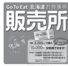
販売所ステッカー