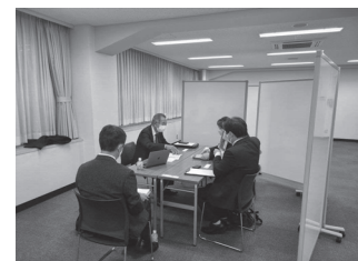
個別商品磨き上げ相談会

実施日 令和4年11月1日(火)～2日(水) 場 所 北海道経済センター 参加者 15社(うちオンライン3社)