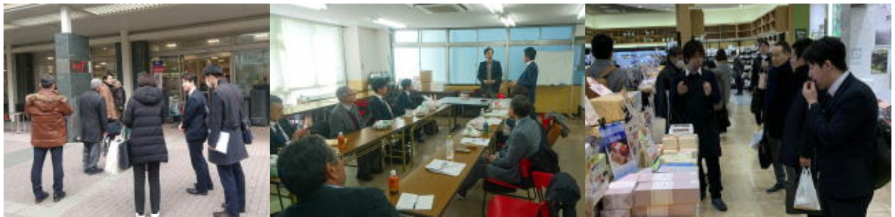
マーケット実態視察会

日時 平成31年2月16日(土) 視察先 川崎市武蔵小杉駅前 デリド武蔵小杉店、イトーヨーカドーグランツリー、 自然食品F&Fグランツリー武蔵小杉店、 久世福商店グランツリー武蔵小杉店、大野屋小杉店 成城石井らテラス武蔵小杉店、九州屋らテラス武蔵小杉店 大野屋商店武蔵小杉東急スクエア店、マルエツ武蔵小杉店 KINOKUNIYA entree 武蔵小杉店 参加者 8名