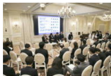
スカナビフォーラム