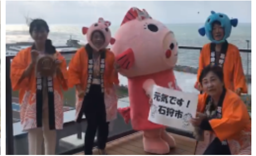
動画「元気です〇〇市・町」