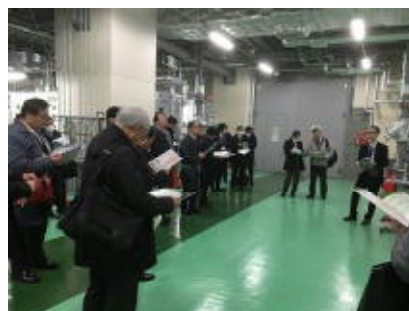
環境・エネルギービジネスセミナー・情報交換会（道央地域）及び視察会