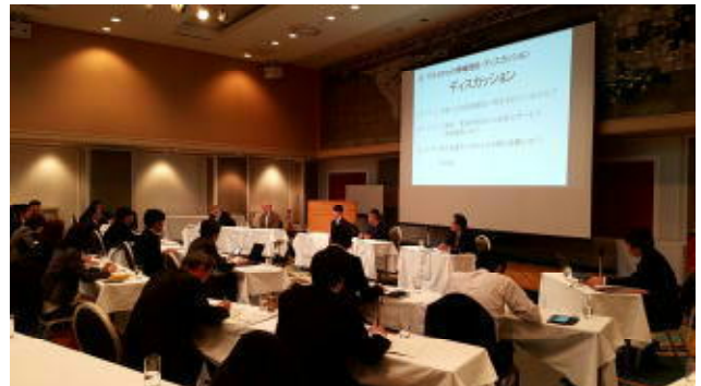
観光連絡担当者会議