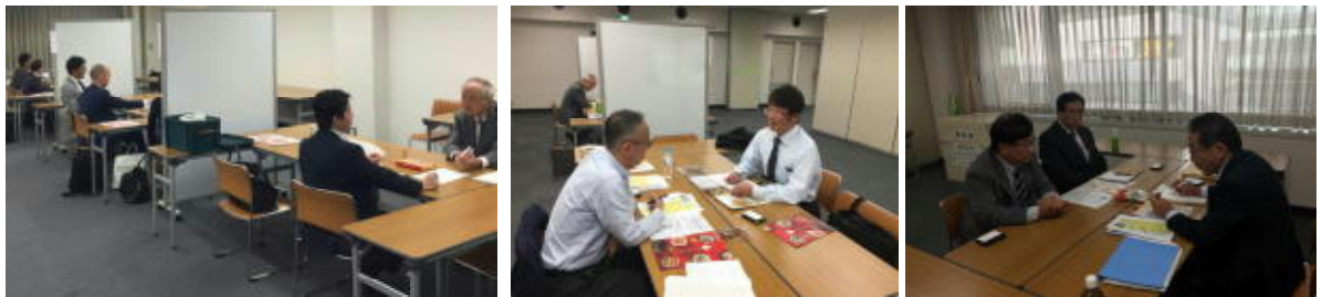
個別商品磨き上げ相談会

日 時 平成30年10月16日（火）～17日（水） 場 所 北海道経済センター、札幌すみれホテル 参加者 13社