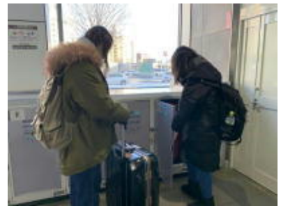
留学生観光アドバイザー事業