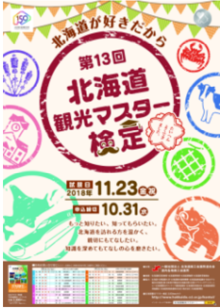
北海道観光マスター検定