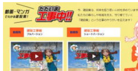
ただいま工事中（建築工事編）