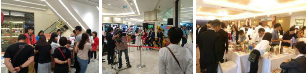
北海道フェアinホーチミン市（販売会・同オープニングセレモニー、商談会）