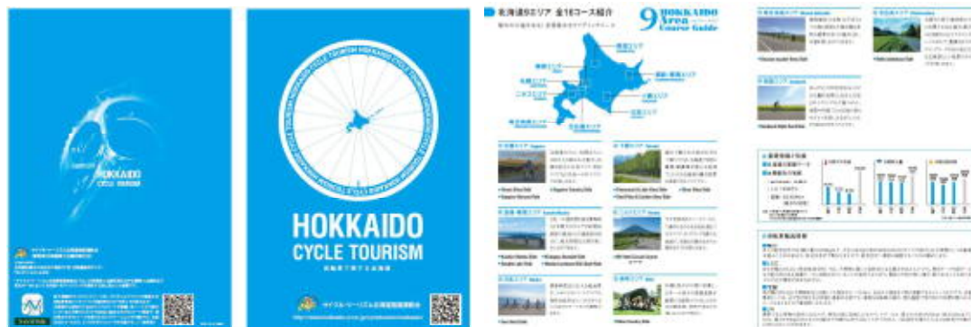
ガイドブック HOKKAIDO CYCLE TOURISM ～自転車で旅する北海道～

P R サイクル・ツーリズム北海道推進連絡会Webサイトに掲載 ( http://www.hokkaido.cci.or.jp/cycletourism-hokkaido/ ) サイクリイベント等における配布