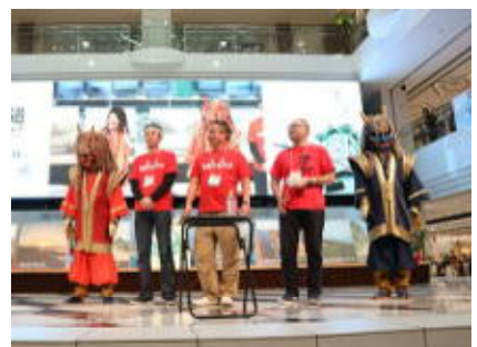
北海道まるごとフェアinサンシャインシティ（オープニング、物産展、PRステージ）