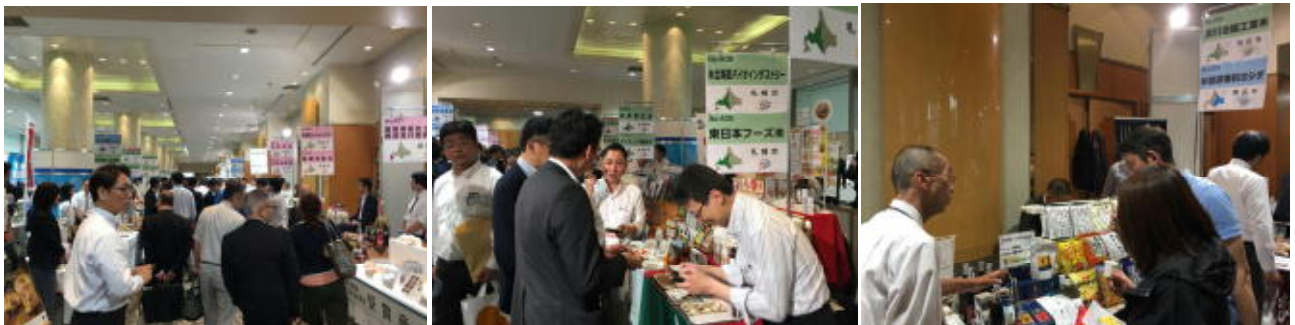
第34回北海道産品取引商談会「道商連コーナー」

日時 平成30年6月5日(火)～6日(水) 場所 ロイトン札幌 主催 (一社)北海道貿易物産振興会、北海道、札幌市 来場者数 2,182名(2日間 会場全体) 出展者数 道内13市町村25社 商談数 152件