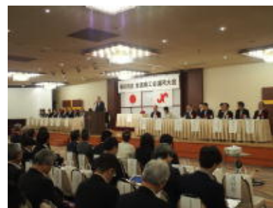
全道商工会議所大会