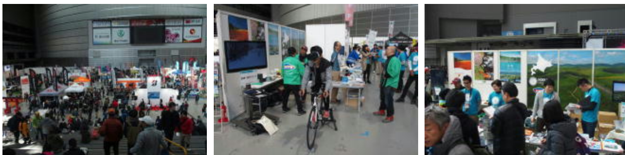
埼玉サイクルエキスポ2019 会場全体・北海道ブース

内容 「北海道ブース」を設置し、サイクリングガイドブックを配布、道内各地のヒルクライムやグルメフォンド等のイベントをPRした。