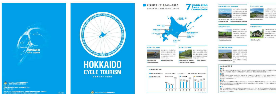
ガイドブック HOKKAIDO CYCLE TOURISM ～自転車で旅する北海道～

作成部数 8,500部(平成30年2月発行) P R サイクル・ツーリズム北海道推進連絡会Webサイトに掲載 ( http://www.hokkaido.cci.or.jp/cycletourism-hokkaido/ ) サイクルイベント等における配布