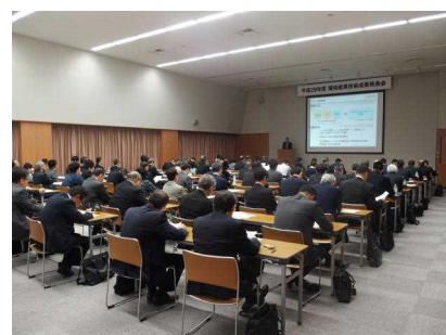
成果発表会・マッチング会

日時 平成30年1月17日(水) 場所 北海道経済センター 出展者 7社 参加者 99名