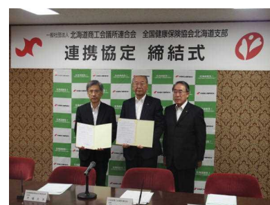
全国健康保険協会北海道支部 との包括連携協定締結式