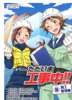
ただいま工事中（施工管理編）

建設業の人材確保に向けて、業界PR漫画冊子「ただいま工事中」の第3弾となる「施工管理編」を北海道建設業協会等と共同で制作し、就活生等に配布した。