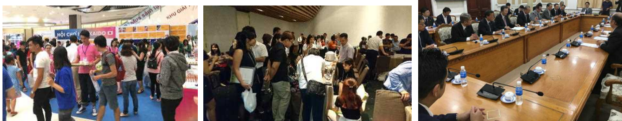
北海道フェアinホーチミン市(販売会、商談会、表敬訪問)