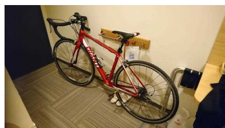
北海道・静岡県サイクル交流ツアー(ゆるゆる遠州ガイドライドへの参加)