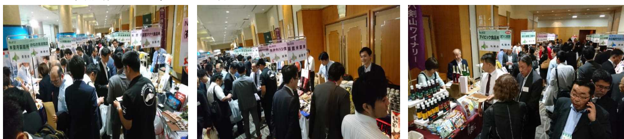
第33回北海道産品取引商談会「道商連コーナー」

日時 平成29年6月6日(火)～7日(水) 場所 ロイトン札幌 主催 北海道貿易物産振興会、北海道、札幌市 来場者数 会場全体：2,036名(2日間) 道内出展者数 道内14市町村25企業 商談数 1,352件