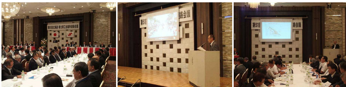
第52回東北・北海道商工会議所連絡会議