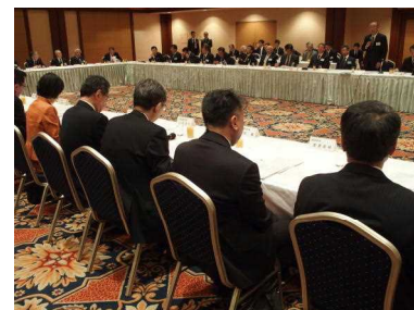
知事等との政策懇談会