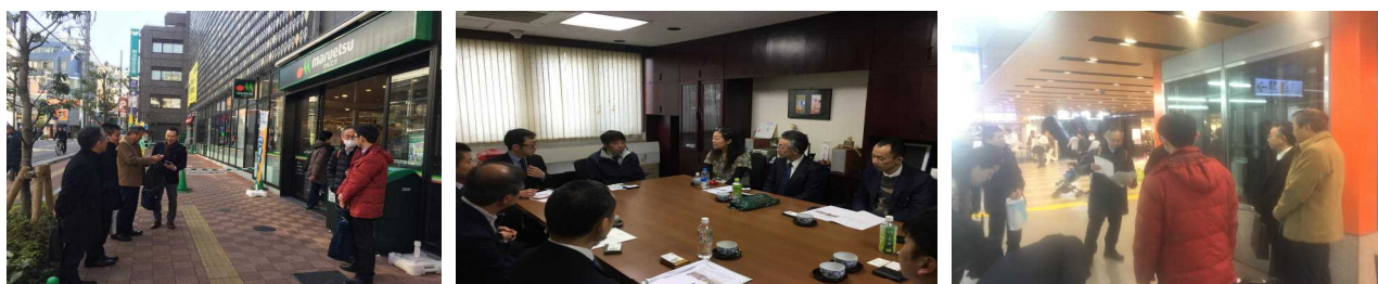
マーケット実態視察会