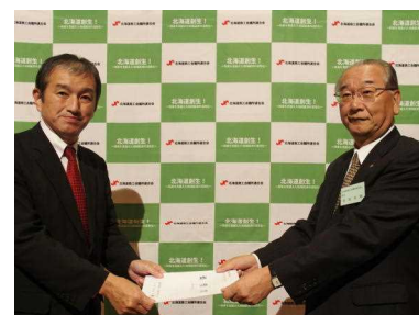
開発局長等との政策懇談会