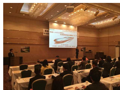
新幹線開業2周年フォーラム