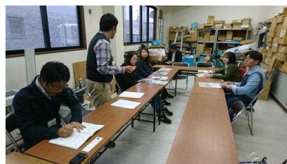
留学生等による観光アドバイザー事業