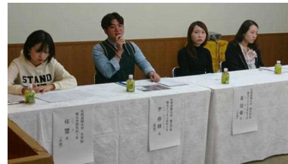
着地型観光フォーラム