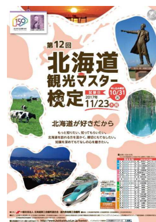
北海道観光マスター検定