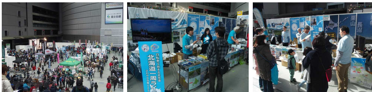
埼玉サイクルエキスポ2018 会場全体・北海道ブース

内容 「北海道ブース」を設置し、サイクリングガイドブックを配布、道内各地のヒルクライムやグルメフォンド等のイベントをPRした。