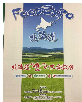
FOOD EXPO 北海道 ～北海道“食”の大商談会～