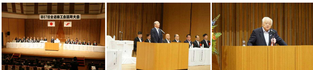
第67回全道商工会議所大会