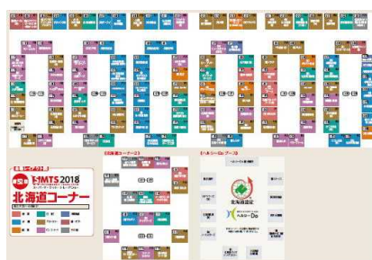
第52回スーパーマーケット・トレードショー2018「北海道コーナー」