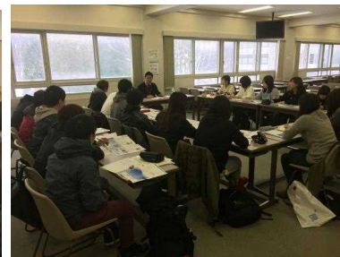
社会人講座授業(札幌国際大学との連携事業)