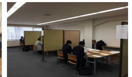
個別商品磨き上げ相談会