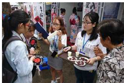
ジャパン・ベトナムフェスティバル