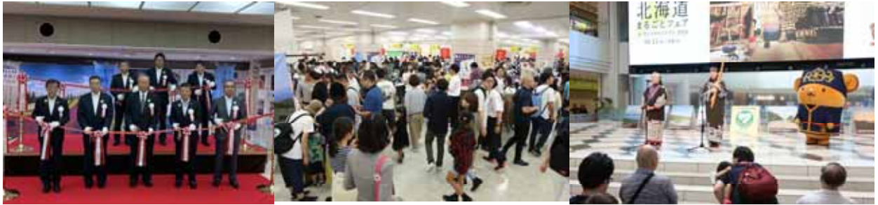
北海道まるごとフェアinサンシャインシティ（オープニング、物産展、PRステージ）

第54回スーパーマーケット・トレードショー2020への出展 道商連が中心となり北海道ブランド販路開拓・拡大実行委員会を組織し、食品流通業界に最新情報を発信する展示商談会に「北海道コーナー」を開設した。道内食品事業者と全国から来場したバイヤーとの商談の場を設けた。