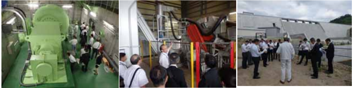
環境・エネルギー視察会