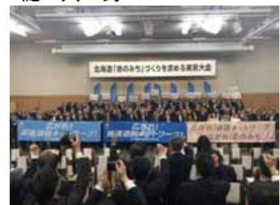
北海道「命のみち」づくり を求める東京大会