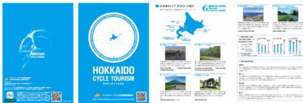
ガイドブック HOKKAIDO CYCLE TOURISM ~ 自転車で旅する北海道 ~

英語・繁体字 各1,000部 P R サイクル・ツーリズム北海道推進連絡会Webサイトに掲載 U R L https://www.hokkaido.cci.or.jp/cycletourism-hokkaido/