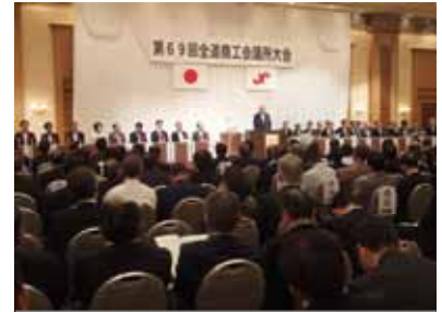
第69回全道商工会議所大会

日時 令和元年6月29日(土) 場所 ANAクラウンプラザホテル千歳 参加者 450名 本大会