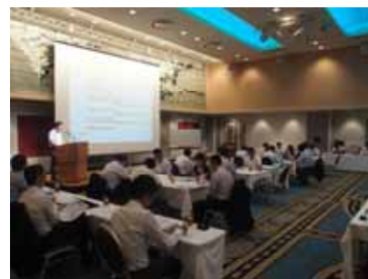
観光連絡担当者会議