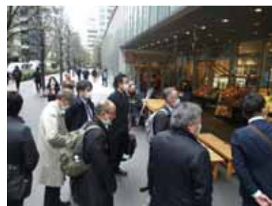
マーケット実態調査

日時 令和2年2月15日(土) 視察先 KINOKUNIYA entrée エキュート上野店、 成城石井アトレ上野店、赤札堂上野店、 北野エースフーズブティック マルイ上野店 のもの上野店、ザ・ガーデン自由が丘上野店 福島屋秋葉原店、ちゃばら日本百貨店しょくひんかん 参加者 5名