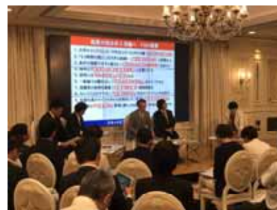
スキャナビフォーラム