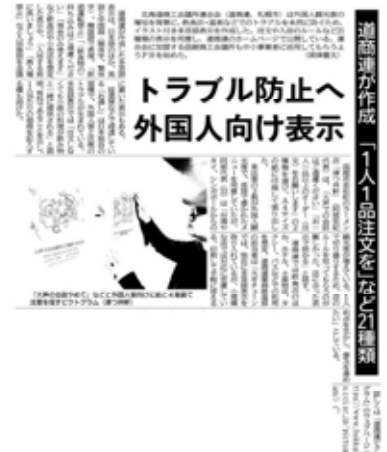
施設等における外国語表記(多言語表示例・函館新聞記事)