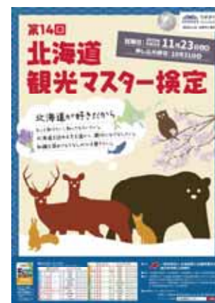
北海道観光マスター検定