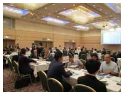
スカナビフォーラム in函館