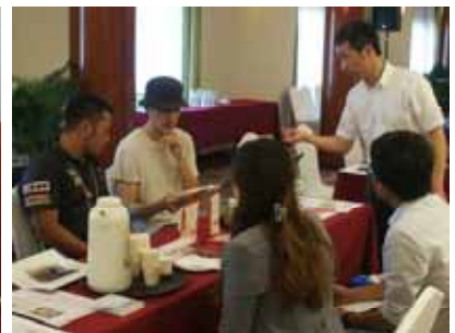
北海道フェアinホーチミン市(販売会、商談会)