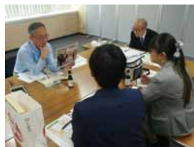
個別商品磨き上げ相談会

日時 令和元年10月17日(木)～18日(金) 場所 北海道経済センター 参加者 17社