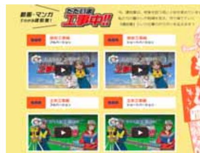
ただいま工事中(土木工事編) 札幌建設業協会HP

制作 (有)エアードライブ URL http://www.sakkenkyo.jp/