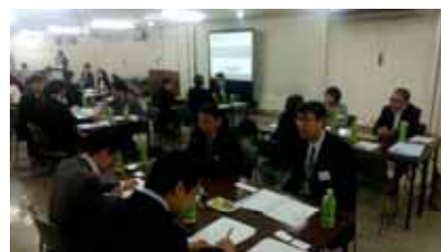
スカナビフォーラム inオホーツク