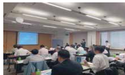
健康企業セミナー

企業の「健康増進」に関する意識高揚に向け、「健康企業宣言」の参加を募り、健康に関する情報提供を行ったほか、「社員が健康に働く環境づくり」をテーマに企業の健康経営を推進することを目的に「健康企業セミナー」を開催した。