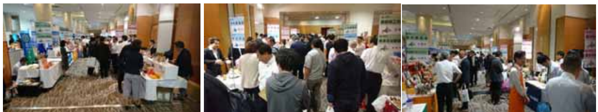
第35回北海道産品取引商談会「道商連コーナー」

日時 令和元年6月11日（火）～12日（水） 場所 ロイトン札幌 主催 （一社）北海道貿易物産振興会、北海道、札幌市 来場者数 2,195名（2日間 会場全体） 出展者数 道内11市町村24企業/団体 商談数 71件